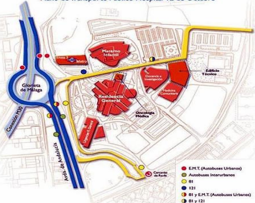
Plano de Transporte Público Hospital 12 de Octubre

Remitir una presentación de Powerpoint con los datos esenciales del caso y los mejores vídeos prenatales al correo medicinafetal.hdoc@salud.madrid.org antes del 20 de noviembre. Su aceptación se comunicará antes del 5 de diciembre. El tiempo programado para la exposición y discusión del caso será 20 minutos.